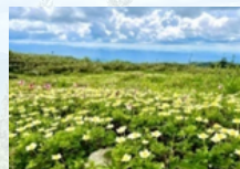
チングルマの花畑