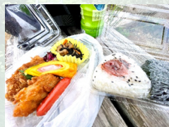
”みなさまの丸伊” 阿仁合店特製 おにぎり弁当